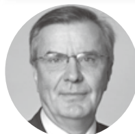
スウェーデン大使 ラーシュ・ヴァリエ氏 推薦