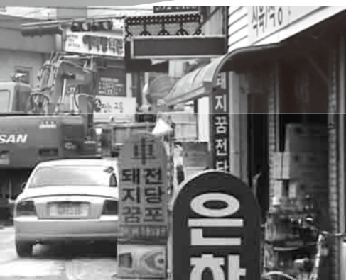
カジノの周囲には質屋の看板が立ち並び、カジノ中毒者は、乗ってきた車を売り払ってまでカジノにのめり込む。(韓国・江原ランド)

カジノが「成長戦略」の切り札に!? 人の「負け」と「不幸」で儲ける 「カジノビジネス」を徹底批判!!